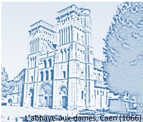
L'abbaye-aux-dames, Caen (1066)

Cette année, la Société Chimique de France Normandie et le Groupe Français d'Études et d'Applications des Polymères-Grand Ouest organisent les journées JNOEJC-GFP Grand Ouest à CAEN.